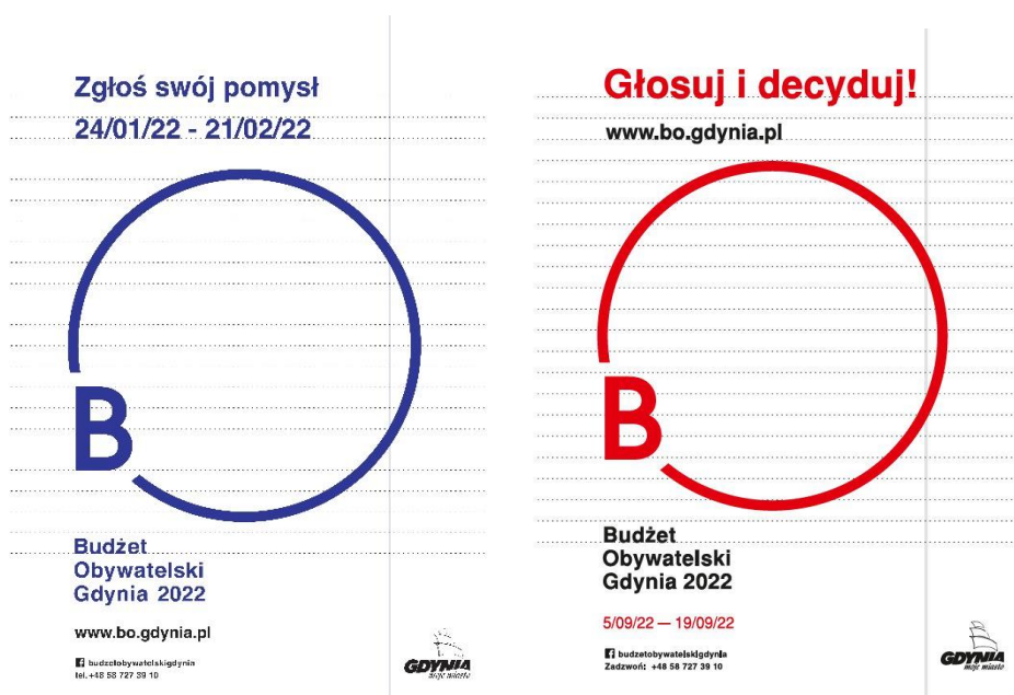
Rys. 2: Plakaty zachęcające do złożenia wniosku i do głosowania na projekty Budżetu Obywatelskiego