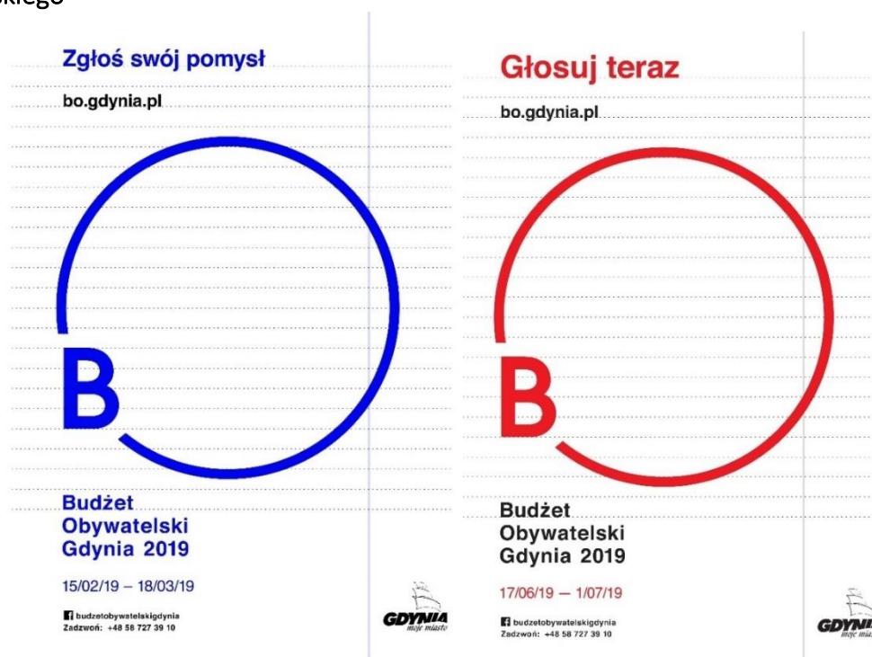
Rys. 2: Plakaty zachęcające do złożenia wniosku i do zagłosowania na projekty Budżetu Obywatelskiego